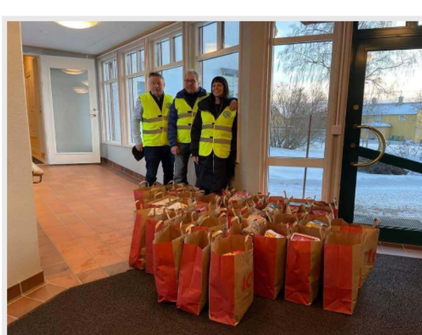
36 matkassar fick rotaryklubben och kyrkan ihop.