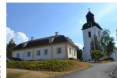
Den gamla prästgården i Järvsö.