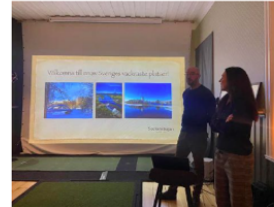
Rotaryklubben gästade Sockenstugan i Järvsö.