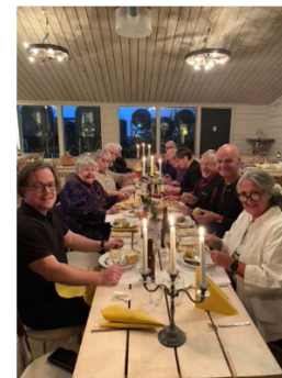
Järvsö Rotaryklubb på Alpbjörns Restaurang och Café.